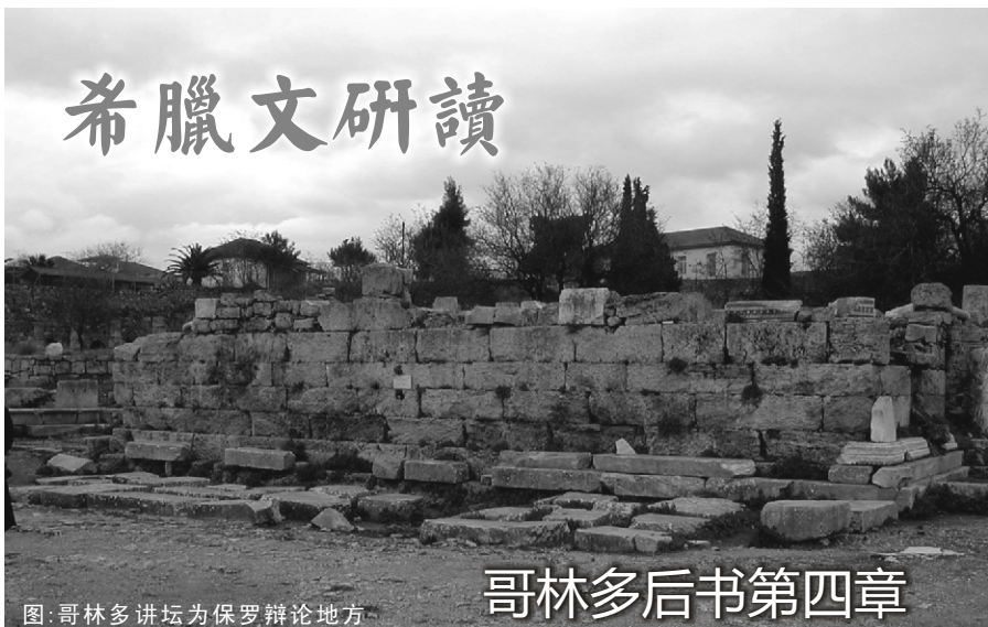
图：哥林多讲坛为保罗辩论地方