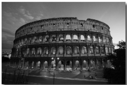
古罗马角斗场遗迹

为众圣徒祈求。当他听说捉拿他的人终于来到那里，他开门迎接他们，并且摆上肉和酒请他们享用，请求他们给他一小时安静的时间亲近主。结果他祷告了两个钟点。罗马兵丁深受感动，并不催逼他，当受审时，审判官非常愿意释放他，所以一再劝他否认主耶稣，但坡旅卡回答说：「我事奉了六十八年的主和救主，从未亏负我，我如何能否认祂呢？」于是他被判火刑。当行刑之前，兵丁要将他捆绑在木柱上，他说：「请你们容许我不加绑索，我相信那一位使我能视死如归的主，必定也会使我在火刑中能牢