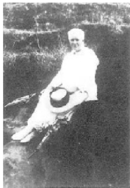
和受恩姊妹于福建罗星塔白牙潭

歌词开始于「如果」，说到「我的道路」与「你的命定」；前者联于实际生活的境遇，后者联于神圣计划的安排。「如果」指明，她跟随主所走的道路及处境，也许会困苦、难为，也许正好相反；不论如何，她的心境就是愿意与主之间的交通越来越亲密、越来越真切。倪弟兄早期翻译此首诗歌时，将「交通益亲挚」译成「交通益缠绵」，那是形容热恋中的情人，彼此难舍难分的心情。她盼望与主甜蜜的交通，时也刻也无间，弥久弥香甜；就是与主的交通一刻也不间断，与主亲密的关系永存常新、甘甜芬芳。「弥」字是个相当好的用辞，形容这交通往前的进展，在时间上长远不断，在性质上越发加多，在空间上普及弥漫。一个完全奉献给主的人，必定完全被主占有，不在意环境是否顺利、工作是否亨通，更不在意任何艰难困苦，只要与主的交通没有间断，越来越香甜，就心满意足了。这节实在是我们向着主相当好的祷告！